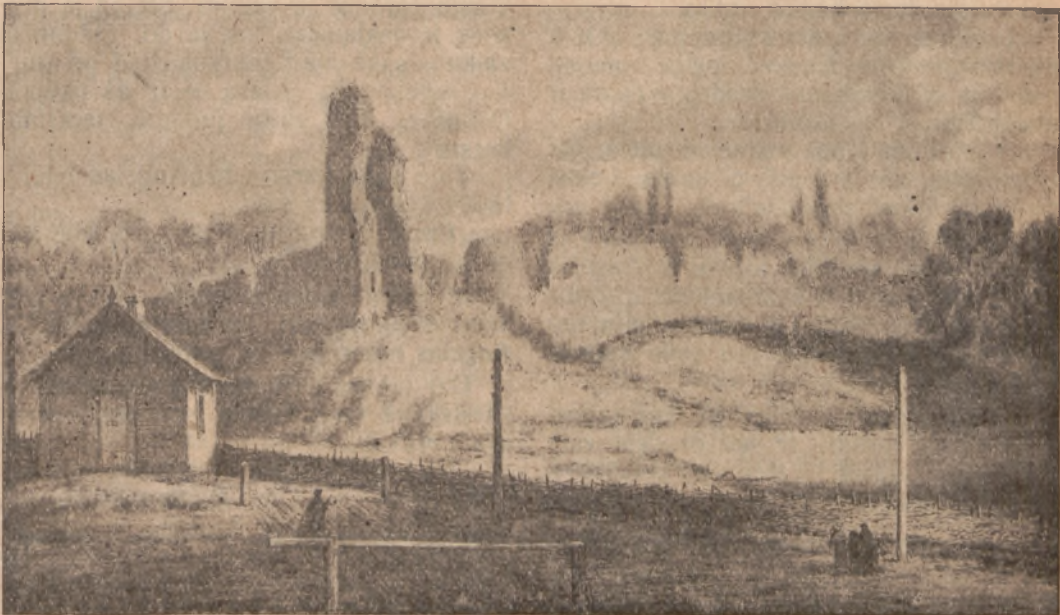
Medininkų pilies griuvėsiai.

Lietuvoje, kol rusai lietuvių ir katalikų persekiojo, visi karštai tikėjo, gražiai gyveno ir kitų kraštų katalikai vadindavo Lietuvą šventu kraštu. Kitaip virsta dabar. Vos pajuto laisvės pavasarį ir nukrito svetimas jungas, jau mūsų pačių tarpe prasidėjo tikėjimo kova. Jau net skaitlingos lietuvių partijos pradėjo ignoruoti (nežinoti) tikėjimą savo veikime; nemaža inteligentų mokinių ir šiaip jau darbininkų, pamoję ranką į tikėjimą, klaidingai galvoja, kad tikėjimas neva užstoja kelią rasti laimę žemėje ir dažnai pikčiau už maskolius veikia prieš tėvų paliktą tikėjimą. Kiek tai pikto ir nepamatuotų priekaištų daroma katalikams lietuvių laikraščiuose ir knygoje? Siaučiant mūsų tėvynėje netikėjimo arba atšalimo bangoms, kas apgins mūsų tikėjimą, kas duos iššermės ir pasiryžimo doru gyvenimu ieškoti sau ir tėvynei laimės?