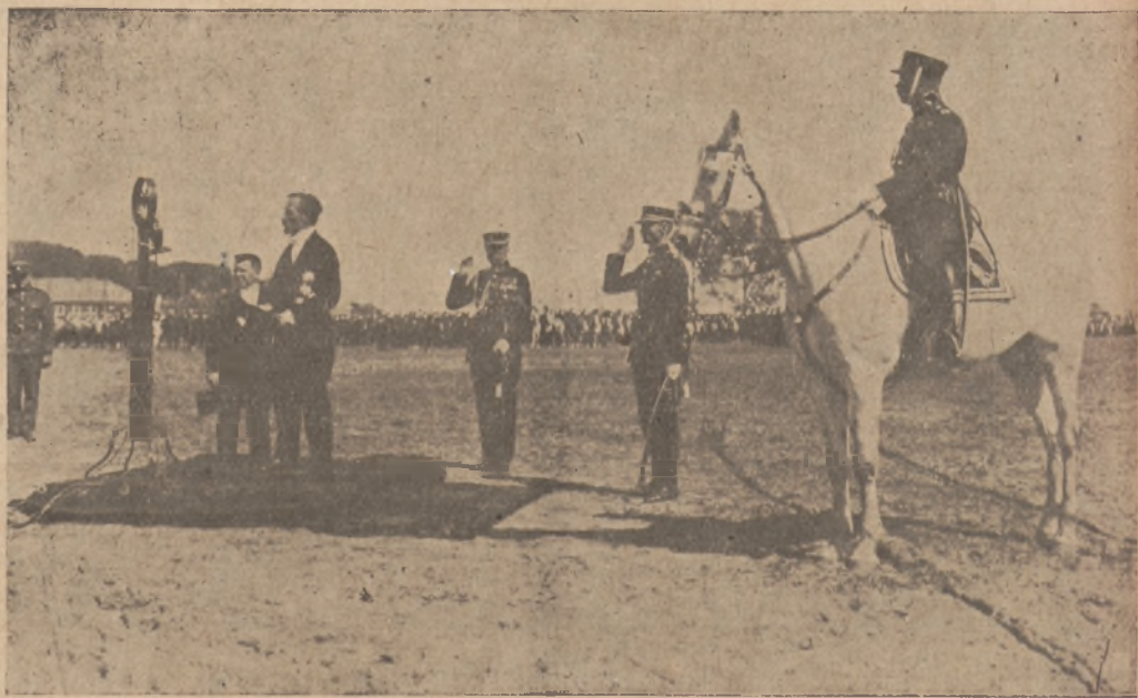
Lietuvių Tautos šventės iškilmės Kaune. Į kariuomenę kalba valstybės prezidentas A. Smetona, kairėje žemiau stovi prof. Voldemaras, dešinėje adjutantai ir ant balto arklio Lietuvos generalio štabo viršininkas gener. Kubiliūnas. Tolumoje matosi Lietuvos raitarija.