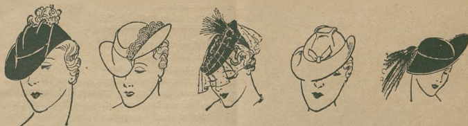
Najnowsze kreacje mody kapeluszniczej w jesieni