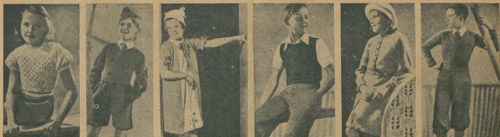
Kostjumy swetrowe oraz ubranka wełniane dla dzieci.