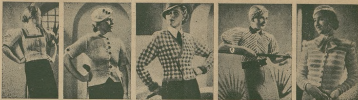
Najnowsza modele z wełny dla Pań.