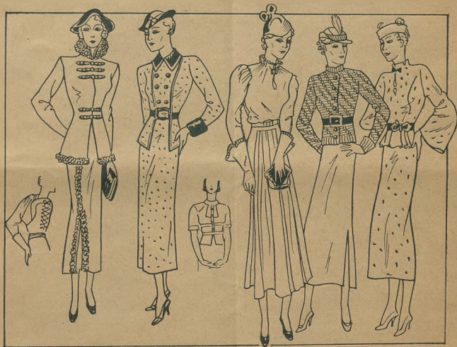
Bardzo elegancki kostjum spacerowy z czarnego „Jersey” z szamerowaniem. Kostjum spacerowy z homespunu — kołnierzyki, mankietki oraz paseczki skórzane. Elegancka suknia spacerowa z czarnego „Jersey”. Szydełkowana bluza oficerska i sukienka. Suknia brąz-koń (Jersey) najnowszy model.

S. KAŁAMAJSKI POZNAŃ . . . TORUŃ WŁASNE GMACHY HANDLOWE.