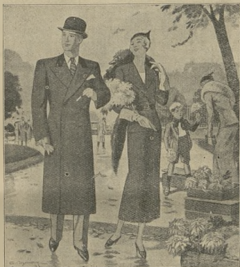
Wytworna Moda jesienna

naszej głównie chodzi o wyeliminowanie żurnali zagranicznych, które się podszycują pod płaszczykiem naszego polskiego języka.