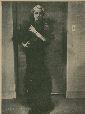
Pląka i urucho gwiazda S. Ellers z Hollywooda w nowej czarno-białej w filmie „General Sutter” (zobacz str. 15).

W posiadaniu powyższych wiadomości, zwróciliśmy się do dyr. Gojchracha — kierownika Universalu w Polsce celem „skontrolowania” tych wiadomości. Nasz rozmówca nie tylko potwierdził nasze dane, ale również uzupełnił je wiadomością o obsadzeniu produkcji Universalu w największych kinach w Polsce.