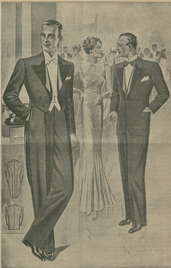
Najnowsze kreacje wieczorowej elegancji Panów