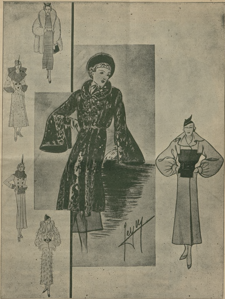
Modele Paryskie 1935-36