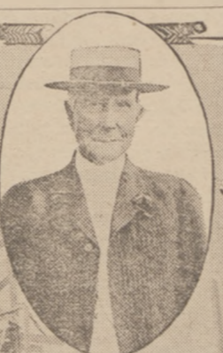
Photo of Rockefeller

W pobliżu Tarrytown, N. Y., znajduje się rezydencja słynnego milionera Rockefellera. Okazała się ta rezydencja za mała i nie można było pomieścić wszystkich gości, którzy odwiedzają "stare-