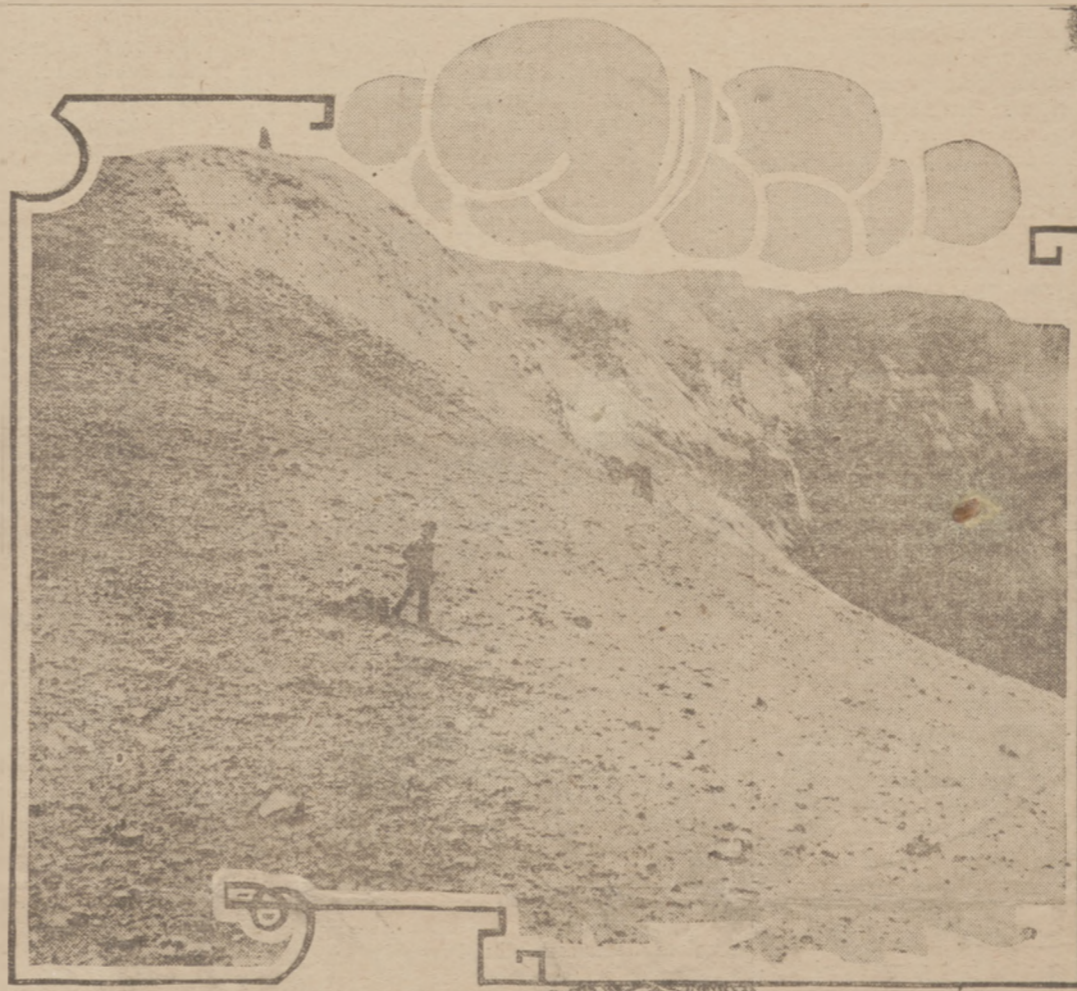
W telegramach znajduje się szereg szczegółów strasznego wybuchu tego wulkanu, który cingle jeszcze wyrzucił lawę, popiół i kamienie.

7 grudnia 1905 roku zgladzili Heningsa, zastępcę gubernatora Kurlandyi;