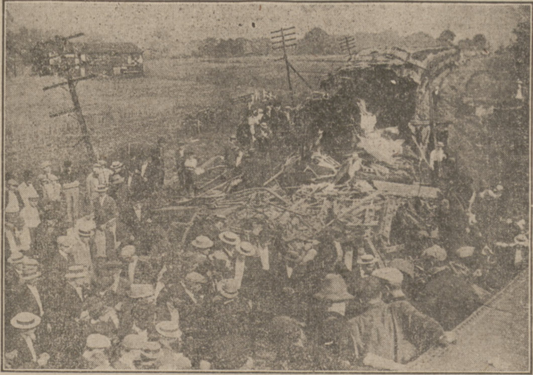
Szczegóły tego okropnego wypadku w którym przeszło 40 osób straciło życie znajdzie czytelnik w telegramach na stronie trzeciej.