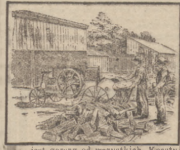
jest gorszy od wszystkich. Kosztuje prawie zawsze tak wiele jak dobry motor, a kosztuje o wiele więcej przez ciągłe reperacje i stratę czasu.