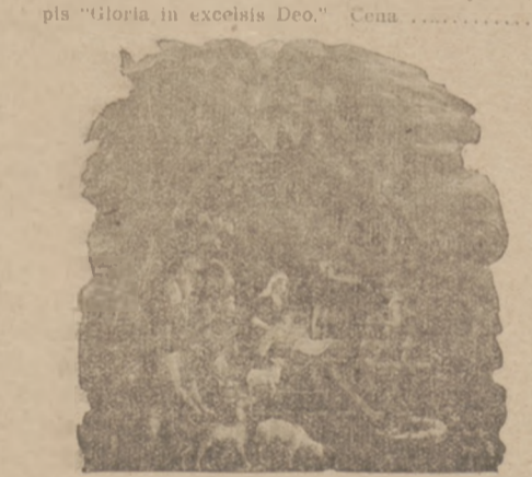
No. 1994. Rozmiar 12x11 cali. Cudowny ten składający się żłobek przedstawia grotę stajenną ustrójoną palmami i kwiatami.