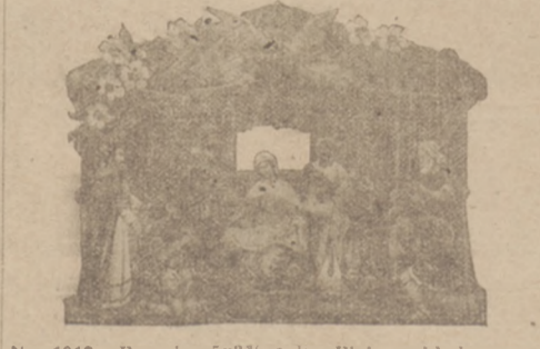
No. 1910. Rozmiar 5x3 3/4 cali. Piękny składany żłobek przedstawiający rodzinę świętą z trzema Królami i pastuszkami.

KSIEGARNIA nasza otrzymała wprost z Europy wielki transport żłobków, które są wykonane w kolorach i są do nabycia po bardzo przystępnych cenach.