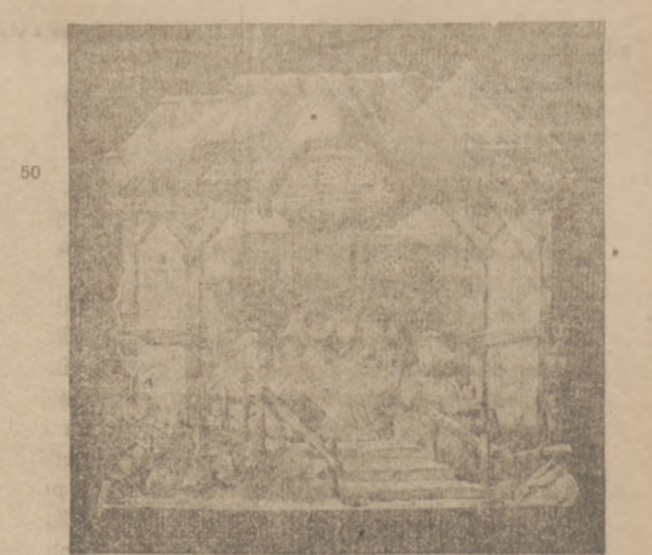
No. 7217. Rozmiar 13 1/2 x 13 cali. Prześliczny ten składający się żłobek jest bardzo mocno zrobiony.