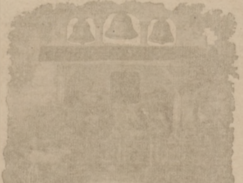
No. 5190. Rozmiar 11 1/2 x 8 cali. Piękny ten żłobek składany przedstawia ubogą stajenkę, w której osobno stoi figura św. Familii w otoczeniu trzech Króli.