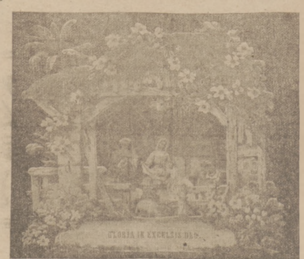
No. 4353. Rozmiar 13x11 cali. Składany żłobek ten piękny przedstawia ubogą stajenkę ustrójoną pięknymi kwiatami.