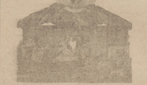
No. 3610. Rozmiar 8x6 cali. Piękny składany żłobek przedstawiający rodzinę świętą z trzema Królami, pastuszkami i aniołami nad stajenką.