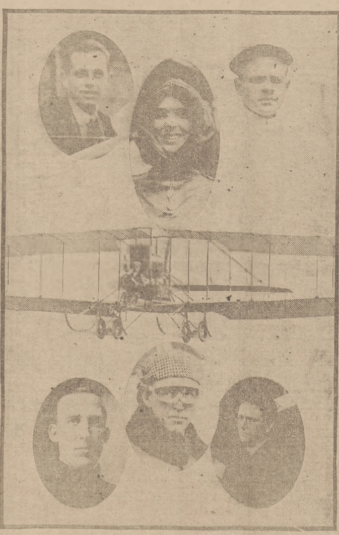
ROCKWELL, HUXSEY, BADGER.

w ciągu ostatnich czterech lat lotnictwa blisko 200 żyć ludzkich padło ofiarą śmiertelnych wypadków. W ostatnich trzech miesiącach zginęło aż 83 ludzi.