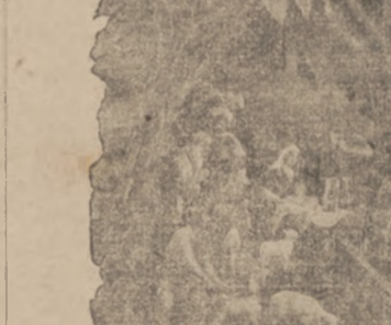
No. 1994. Rozmiar 12x11 cal. Cudowny ten składany ziółek...