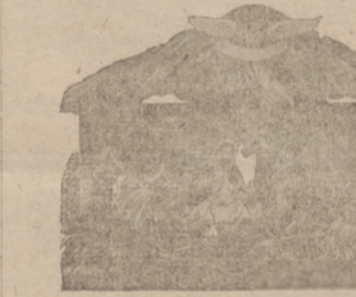
No. 3910. Rozmiar 8x6 cal. Piękny składany ziółek...