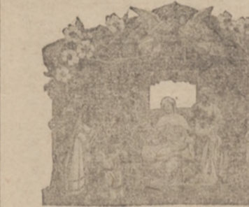
No. 1910. Rozmiar 5x3 3/4 cal. Piękny składany ziółek...