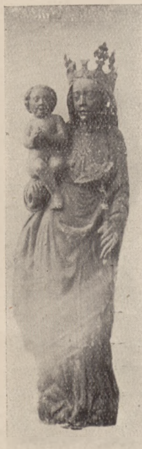
Madonna z Płaszkowej około r. 1430.

Część pierwsza, napisana przez Ryszarda Hamanna, profesora uniwersytetu w Marburgu, jest jedną z najlepszych historyj sztuki ostatniej doby, ujmującą szeroko dzieje prądów i stylów, z uwzględnieniem ich podłoża społecznego, ich wzajemnych oddziaływań i przemian. Dzieło to rozeszło się w oryginale w imponującej ilości 300.000 egzemplarzy, dosłownie w całym świecie, i to niespełna w ciągu jednego tylko ubiegłego roku!