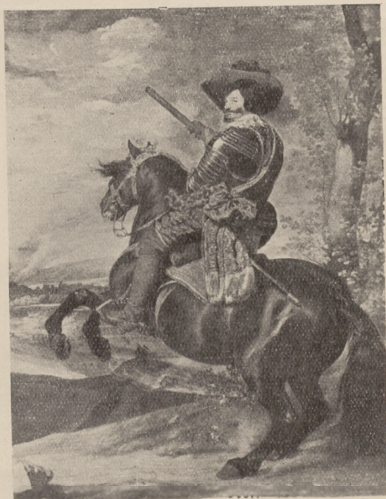
Velasquez. Książę Olivarez, Madryt, Prado.

WARSZAWA, NOWY-ŚWIAT 35. KONTO P. K. O. 196