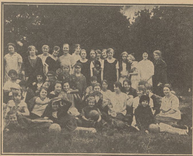
Une excursion dans les environs de Varsovie,

Les foyers des „Cercles des Polonaises“ possèdent actuellement environ 450 membres et 11 groupements dans deux centres. Leur but est d'influencer le milieu qui les entoure, de travailler de concours avec ce dernier. A l'aide de visites à domicile, de réunions de mères, ces organisations tendent à entrer en contact plus immédiat avec le milieu où elles évoluent en y faisant, entre autre, la propagande de l'hygiène.