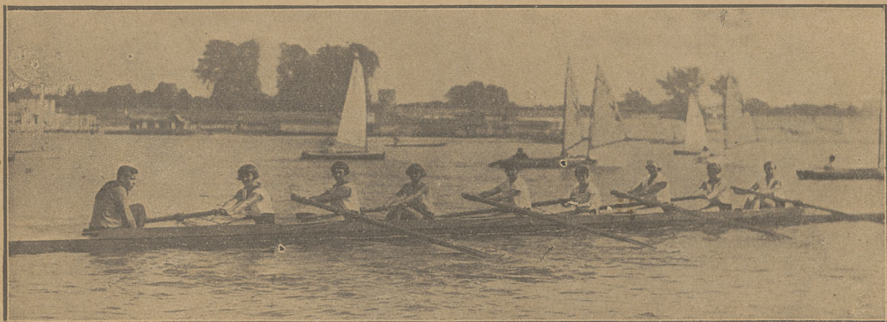
Sur le nouveau canot de course.

Le jubilé du Club des Canotières de Varsovie était fêté par toutes les canotières de Pologne. A cette occasion on avait baptisé 6 canots nouvellement achetés par le Club.