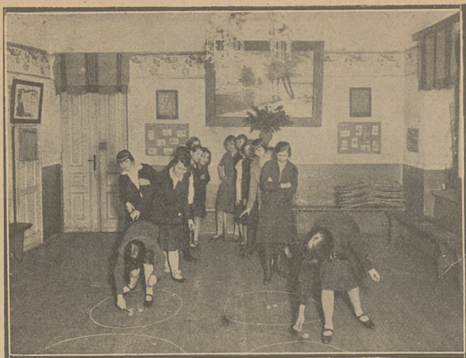
Foyer du „Cercle des Polonaises“ Jeux de Société.

consiste à organiser des réunions de jeunesse dans diverses associations groupant la jeunesse pour des buts spéciaux.