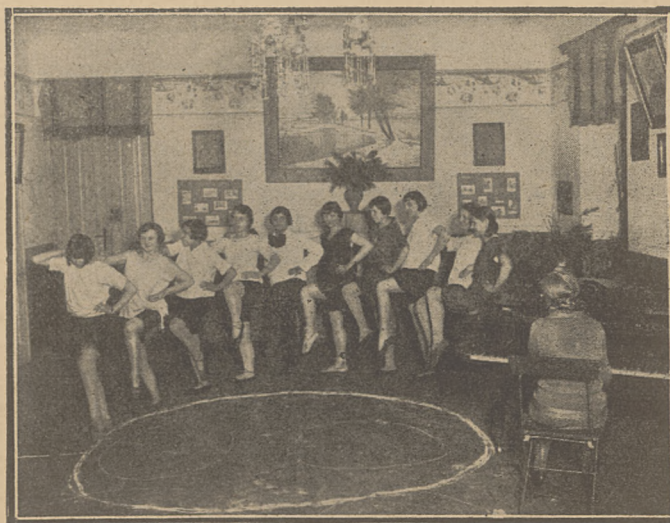
Leçon de rythmique.

Il est à peine besoin de souligner que la tendance à ce que les foyers deviennent non seulement une source de récréations pour ses membres, mais un centre du développement intellectuel de la jeunesse, un trait d'union entre cette dernière et le travail, la vie et l'humanité, est une entreprise des plus graves. Elle exige non seulement des travailleurs entendus et des hommes possédant le sens de leur idéal consistant à parfaire les âmes au nom de l'Amour et de la Fraternité Sociale, mais en Pologne, surtout, il lui faut des pionniers persévérants, sachant créer et mener à bien une grande oeuvre malgré le manque des aménagements et le manque de fonds.