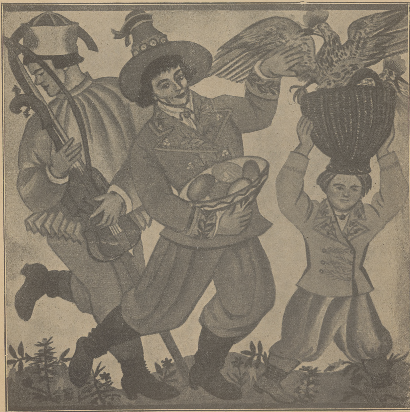
Les cantiques de Noël

Les représentations de la „chopka“ cessent une fois le carnaval fini, — et tous les souvenirs de la Noël sont remis au prochain avent.