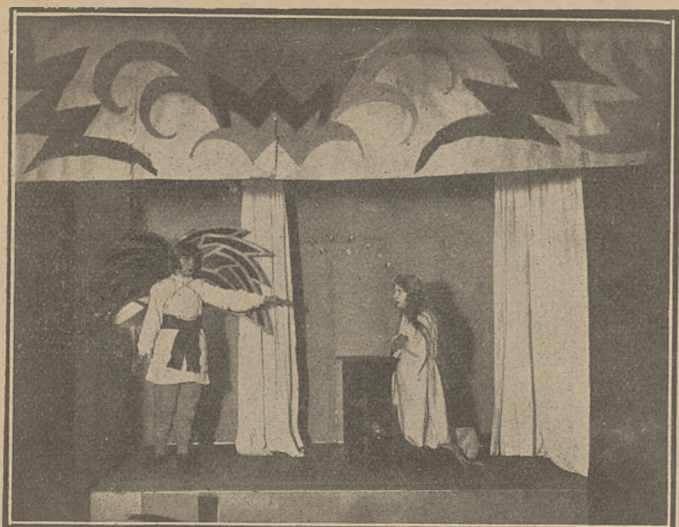
Une représentation de la „chopka“.

La Société „Le Foyer“ concentre la jeunesse féminine et masculine, à condition qu'elle aie fini l'école primaire, étant d'avis que cette époque de sa vie est la plus importante pour le travail préparatoire et l'initiation à la vie sociale. Désirant créer le type d'un bon citoyen - démocrate cette organisation tâche de développer dans la jeunesse l'indépendance des opinions et des aperçus en organisant à cet effet des discussions, des comptes - rendus, des conférences, (Etudes sur l'Etat et l'humanité) des lectures choisies, et l'entraînement à la vie des clubs.