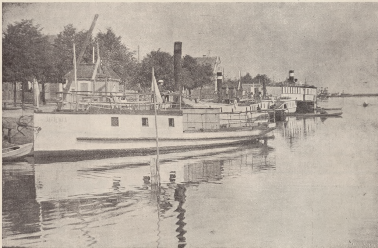
Statki na rzece Prypeć, która prawdopodobnie stanowiła drogę przybycia Polan z pod Kijowa nad Gopło w latach 870 po Chr.

rody w owym czasie zawdzięczały swe przeobrażenie organizacyjne jakimś naciskowi z zewnątrz. Ten zewnętrzny nacisk, zwykle obca dyktatorska