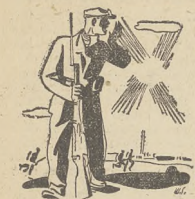
AUDYCJA SŁOWO-MUZYCZNA W PIĄTEK 27 XII O GODZ. 18.00