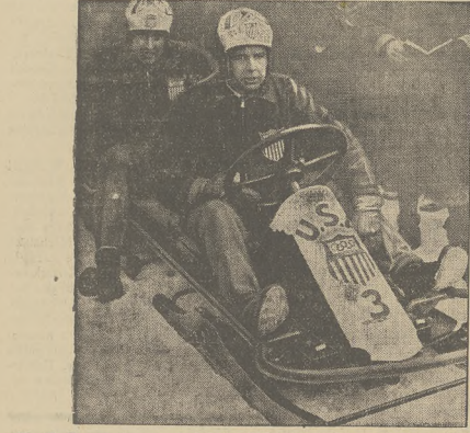
Obsada dwuosobowego bobsejki, „USA II”, która zdobyła złoty medal olimpijski.