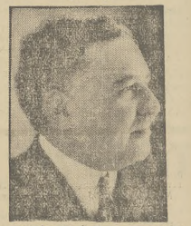
Leon Daudet, jeden z przywódców rojalistycznej organizacji „Action Francaise”, rozwiązanej w związku z napadem na Leona Bluma.

wracające osy dają swym towarzyszkom w gnieździe najwyraźniej znak do odlotu. Kiedy mianowicie te, które powróciły, milczą? — To żadna os nie wyleci. Kiedy, przeciwnie, brzęczą cichutko, — natychmiast się inne do lotu szykują.