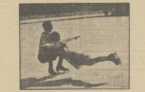
Maxie Herber i Ernst Baier, zdobywcy pierwszej nagrody w jeździe sruż- czek na lodzie parami. Oto jedna z efektywnych figur ich tańca