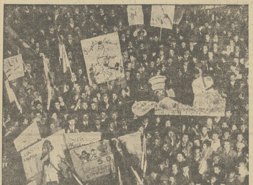
Na wiadomość o zwycięstwie pod Endertą ludność Rzymu manifestuje.