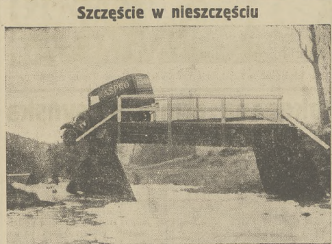
W ostatniej chwili udało się kierowcy zatrzymać samochód nad przepaścią, w chwili, gdy most częściowo runął. Wypadek miał miejsce blisko Melbourne w Australji.

Omawiając wypadki, jakie miały miejsce na uczelniach akademickich, (Dalszy ciąg na stronie 2eiej).