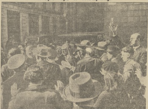
Tlum, demonstrujący przed gmachem rządowym. Nowy gubernator Molles uspokaja podnieconych manifestantów.