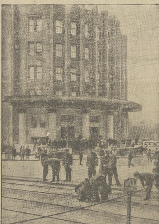
Jak wiele innych gmachów rządowych, został gmach policji w Tokio zajęty przez wojsko I. dywizji.