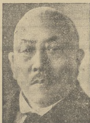
Ofiarą zamachowców padł premier Osa