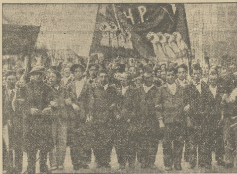
Demonstracyjny pochód komunistów, którzy zostali przez nowy rząd hiszpański zwolnieni w liczbie 20.000, dzięki ogłoszonej amnestii.