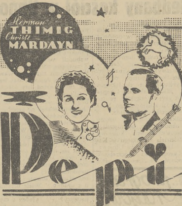
„PEPI” WKRÓTCE W KINIE „KOPERNIK”