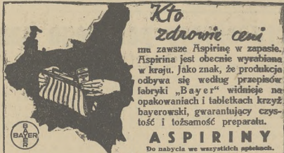
Cena za 6 tabl. obecnie już tylko zł 0,90, za 20 tabl. zł 2,25

— List brzmiel: „Hochgeherrt und sehr gnädiger Herr Graf. Stosownie do polecenia, otrzymanego w ostatnim liście, obnizyłem dziś do połowy onlatę za pobyt w moim