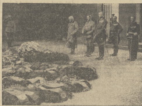
Dnia 8 bm. czcili Niemcy pamięć poległych w wielkiej wojnie. Na zdjęciu Hitler w towarzystwie marszałka Mackensena, po złożeniu wieńców.

Groźna dla nich może być tylko kontrakcja. Ale jaka? Wojna? Wyklu-