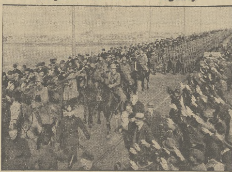
Wkroczenie wojsk niemieckich do Nadrenii przez most na Renie w Moguncji.