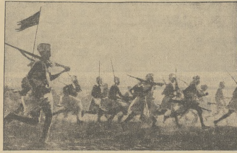
Zdjęcie z ostatnich walk w Tembienie. Askarowie włoscy biegają do ataku na górę Amba Aladzi