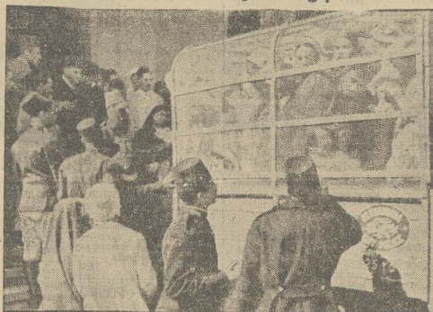
W Egipcie młodzież demonstruje na rzecz niezawisłości swego kraju. Za- trzymanych manifestantów policja przewozi samochodami ciężarowymi, za- bezpieczonymi drucianą kratą.