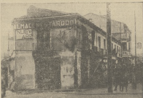
Komunistyczne demonstracje w Hiszpanji, które pochłaniają wiele ofiar w klasowych i rannych, powtarzają się z niesłabnącą siłą, przyciem kościoły, zabijają i przedsiębiorstwa prywatne padają pod palce. Na zdjęciu: zdemolowany dom handlowy.

organizacji prawniczej została zasztyletowana, zaś jedna dziewczynka została przypadkowo zabita z rewolweru. W Fuera del Sol wynikło starcie pomiędzy młodzieżą faszystowską a komunistyczną. Wymieniono szereg strzałów rewolwerowych, które nie spowodowały ofiar w ludziach. W Madrycie dano z samochodu kilka-