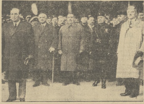
Mussolini wita na dworcu w Rzymie premiera Węgier Gömbösa, oraz kanclerza Austrii Schuschnigga. Od lewej: Gömbös, Kanya, Waldenegg, Mussolini i Schuschnigg.

instynktu narodowego i państwowego tych żywołów i tych partji, które na akcję zamieszek wierają dzisiaj swój wpływ, aby uniemożliwić komunistom kontakt z masami. Oczywiście, że jedną drogą jest tu bezwzględne zahamowanie wszelkich zamieszek. Innej drogi nie ma i jakkolwiek inne próby dławienia agitacji komunistycznej w czasie zamieszek chybi celu. Wzmoże bowiem tylko natężenie starcia, a oto wyłącznie kierownictwu komunistycznemu chodzi. „Dziło” kreśląc rzekomo ponurą sytuację w kraju, zdąży — jak się jednak okazuje w konkluzji — do jednego celu: