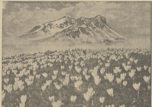
Krokusy, pierwsze zwiastuny wiosny, pokryły górskie doliny.