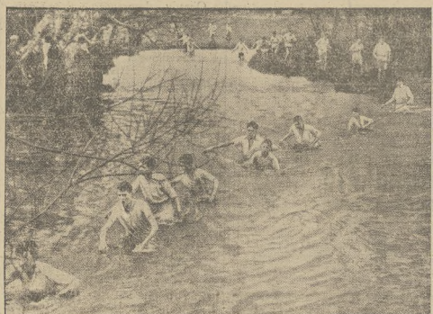
Doroczny bieg na przelaz uczniow Braclifield College w Anglii. Uczestnicy przebywają w bród zimny i rwący strumień