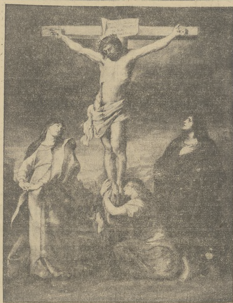
CHRYSTUS NA KRZYŻU