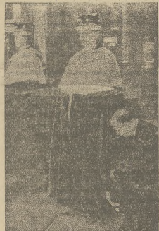
W Londynie rozpoczęła się gorączkowa praca. Krawcy przystąpili do przygotowywania strojów dla uczestników przyszłych uroczystości koronacyjnych. — Stroje te będą bardzo kosztowne — usłó bior łród, widoczny na zdjęciu, pochłonie kwotę około 5.000 zł.

Warszawa, 8. 4. (Tel. wł. — mg.) Jak się wia, Ministerstwo Skarbu prowadzi obecnie prace przygotowawcze na wprowadzenie w życie nowych zasad rachunkowości podatkowej, upraszczającej technikę poboru podatków. Nowy system zrywa z dotychczas stosowanymi w rachunkowości podatkowej księgami bieżczymi i sprwadza na ich miejsce kartoteki. Wprowadzenie nowego systemu rachunkowości ma mieć ważne znaczenie dla planików, daje im bowiem pewność, że kwota pobrana zostanie natychmiast odkontowana i nie będzie wypadku powrotnego żądania zapłaty na należności.