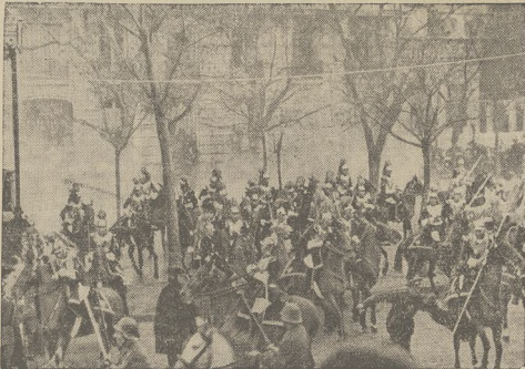
Uroczystości związane z piątą rocznicą istnienia republiki hiszpańskiej miały w całym kraju przebieg bardzo niepokojny. Bilansem rozruchów są 3 zabici i 23 rannych. W Madrycie, w czasie uroczystości zrucono bombę pod trybunę prezydenta republiki. Na zdjęciu chwila wybuchu.