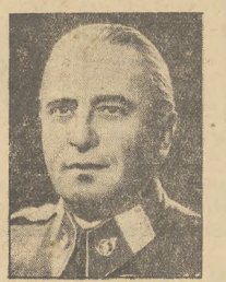
Nowy wicekanclerz w. Baar-Barenfels.