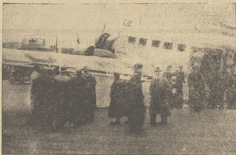
W dniu 23 bm. w obecności króla Gu stawia nastąpiło otwarcie nowego lotniska na placu Bruma w Stockholmie.