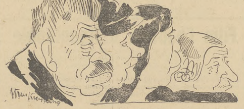
TYPY Z ŁAW PUBLICZNOŚCI