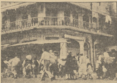
Wrogie nastroje, panujące między Żydami a Arabami w Palestynie pogłębiły się do tego stopnia, że Jerolim i Tel Awiw podobne są do miast obłożonych. Równocześnie nastąpiła masowa uciezka Żydów z dzielnicy arabskiej Jerolim do części zamieszkałej wyłącznie przez Żydów. Na zdjęciu wdruwka żydowskiej ludności.