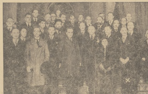
Premjer ministrów Leon Blum (oznaczony krzyżykiem) wraz z członkami nowo utworzonego przez siebie gabinetu.

lucjonizowaniem życia francuskiego, jest zbyt blisko, pod ręką, na miejscu. Kto wie, czy niezdrowy aljans nie skończy się katastrofą całej kunsztowno-jej kombinacji, kiedy zdrowa