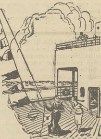
„Przeprałam właśnie kilka kawalców. Czy moglibyście je razem zoss wiesić?”