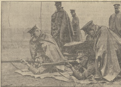
Tegoroczne manewry armii angielskiej pod Bisley odbywały się w czasie wielkiej ulewy. Żołnierze odkrywali broń płaszczami, aby ochronić ją przed wilgocią.