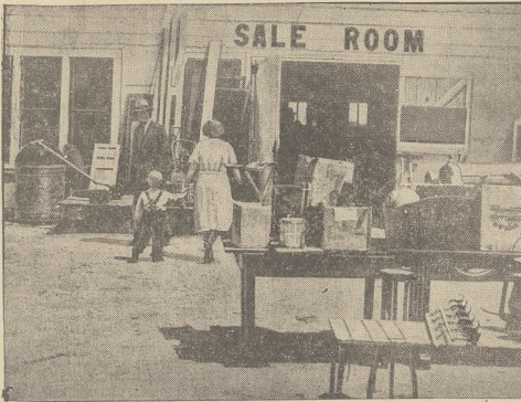
Niesłychana posucha w Ameryce pozabawiła majątku setki rodzin, które wyprzedają mienie i idą na tulaczkę.