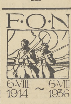
Fodobna nalepki, która ozdobi okna kamienic lwowskich w dniu 6 sierpnia b. r.

nych, których jedynym celem była niepodległość Polski.