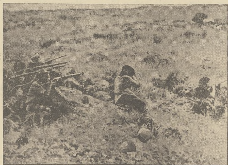
Grupa milicji rządowej na przełęczach górskich pod Madrytem.

ści. Dopiero wojna w Afryce otworzyła ujście dla włoskiej ludności nieprodukującej.