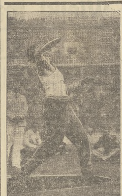
Carpenter (U. S. A.) zdobywa złoty medal w rzucie dyskiem.

Na ostrze, jakiego galopy jeźdźcy, startujący we wszechstronnym konkursie konia wierzchowego udają się na tor wyciszony, znajdujący się w pobliżu Ruhleben.