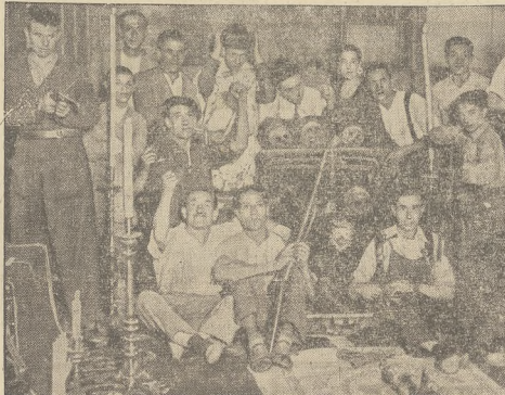
Zamieszczamy zdjęcie, przedstawiające jedną z wstrząsających scen, jakie odgrywa się w kościołach madryckich. — Komuniści bezczeszczą świątynie — nie szanując nawet grobowców.