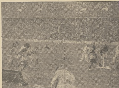
Zwycięzca mulat amerykański Wood ruff przed Lancim (Włochy) i Edwardem (Kanada). Cztery — Ku charski (Polska).