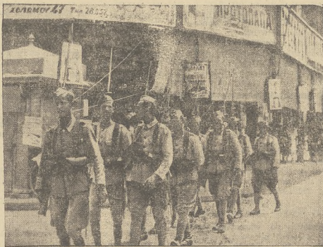
Patrol wojskowy na ulicy Aten po ogłoszeniu stanu wojennego.