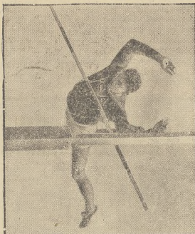
Wspaniałym skokiem o tyczce Amerykanin Meadows zdobył złoty medal olimpijski.