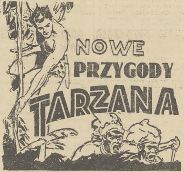
w kinie „Atlantic”

— MAGAZYN FOSFILI R. DRZAŁA, Lwów, Chorzowszyna 5, poleca kolory, matce, przerabiał kolory po 4 zł, matce po 6 zł, przyjmując pierze do prania, 50/250/1.