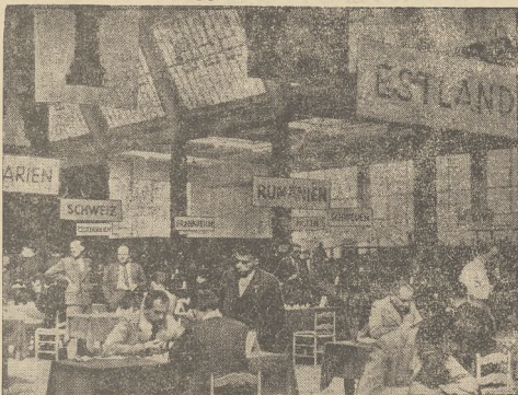
W Monachium odbywa się obecnie Olimpiada Szachowa, w której bierze udział 210 najlepszych szachistów świata, reprezentujących 21 narody.