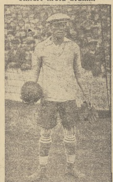
Najśmieszniejszy brankarz świata Zamora zginął na polu bitwy podczas wojny domowej w Hiszpanii