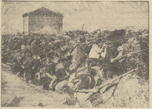
Z krwawych walk w Hiszpanii: odcinek frontu wojsk rządowych pod Sierą Guadaramą. Jak widać na fotografii, rząd madyrycki musi się poskładać formacjami nieregularnymi, naprzecde zorganizowanymi z pośród elementów robotniczych Madrytu.