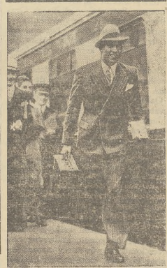
Amerykański biegacz Jesse Owens powraca do ojczyzny na pokładzie „Queen Mary”.