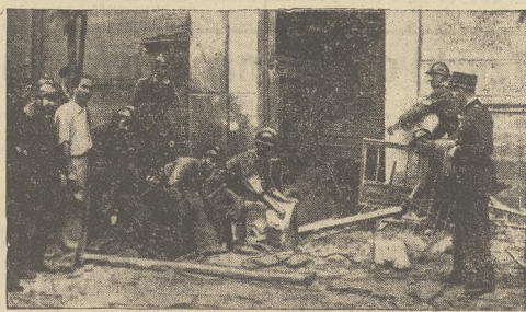
Pod każdym bombardowaniem San Sebastian, o które zaczęli walczyć powstańcy, miejscowa straż pożarna ma wiele pracy. Na fotografii jeden z strażaków trzyma odłamki pocisku z działa okrętowego, który przebił gmach od dachu

Wzrosła również organizacja, związana z bezpieczeństwem i akcją przeciwpożarową na terenie Tarnopolszczyzny. Ochotnicze Straże Pożarne, których placówki w r. 1927 dochodziły do 239 jednostek, zanotowały w 1935 r. 666 jednostek organizacyjnych, a więc wzrost niemal trzykrotny.