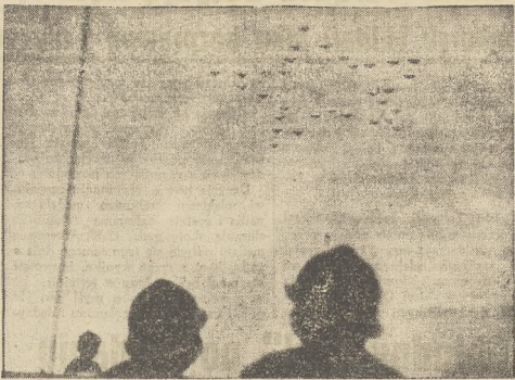
Eskaadra samolotów sowieckich, formująca na tle nieba pięciokątamienna gwiazdę.