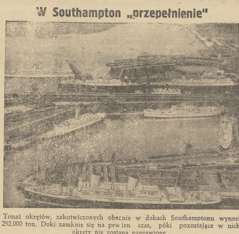
Tonaż okrętów, zakotwiczonych obecnie w dokach Southamptonu wynosi 292.000 ton. Doki zamknięte są na pewien czas, póki pozostające w nich okręty nie zostaną naprawione.