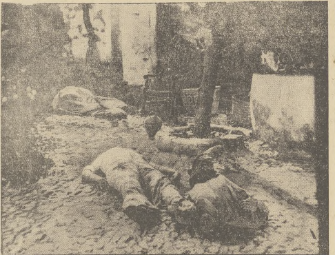
Oto obrazek z miejscowości Salvedra w prow. Huéla, gdzie czerwoni na krótko przed wkróceniem wojsk narodowych wymordowali w bestialski sposób wszystkich zakładników. Na ulicy walają się trupy wymordowanych zakładników, postawione jako widome znaki czerwonego barbarzyństwa.