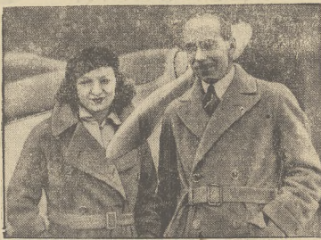
Campbell Black, znakomity lotnik angielski, zwycięzca raidu Londyn — Melbourne, zginął śmiercią lotnika na lotnisku w Liverpool. Na zdjęciu Campbell Black ze swą młodą żoną Florence Desmond, znaną aktorką teatrów londyńskich.