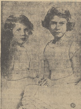
Przypuszczalna następczyni tronu, ks. Elżbieta wraz z młodszą siostrą ks. Małgorzatą-Róią.