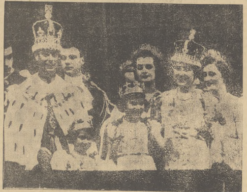
Drugi fototelegram otrzymany z Londynu w dniu Koronacji przedstawia króla Jerzego VI-go, królową Elżbietę, oraz księżniczek: Elżbietę i Margarytę Różę z koronami na głowach, bezpośrednio po akcie uroczystej koronacji angielskiej pary królewskiej.

niektórych umieszczono kluby komunistyczne lub inne organizacje bezbożnicze. Wszystko to nie odstraszyło poganających skłódek i po 20 latach propagandy ateizmu i przeludowania religijnych ludność sowiecka garnie się do świątyni, trzymając się kurczowo wiary.