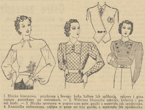
1. Bluzka kimonowa, przybrana z lewego boku haftem lub aplikacją, rękawy i góra zapięta guzikami na tasiemkach. — 2. Wzbiłna bluzka szkolna, kołnierzyk i pas cięty biały. — 3. Bluzka sportowa w poprzeczne pasy, guziki z materiału jak spodniczek. 4. Kamizelka siatkowa, spięta w pasie na trzy guziki, z materiału jak spodniczek.

Najdrastyczniejsze przykłady niespodziewania naszych czynności wykazywano na podróże. Zepsuta walizka w ostatniej chwili oddaje się do naprawy bylejak, bo zależy na pośpiechu, pakowanie w ostatniej chwili i zapomnienie najpotrzebniejszych rzeczy, które re dokupują się w podróży, oddawanie walizki taragatowi, gdy doskonale możemy zanieść samej etc. Zapominamy, że śpieszenie się jest wrogiem szybkości wykonania, że trzeba palki przybrać, a nie rzadko i zdrowiem za brak planowości w naszej pracy.