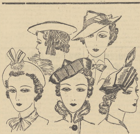
Najmłodniejsze kapelusze na obecnym sezon: o większych kreacjach — do płaszczy o niskich kołnierzach, zaś mniejsze — stosownie do futer.

Albo ucieknę w ciemną melancholię spinyę w najcichszy śpiew w rzece spienionych tęsknot i wspomnień utopię boleść i gniew.