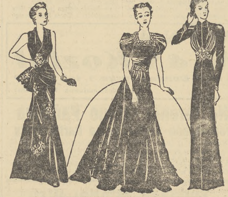
1) Suknia wieczorowa ze złotej lamy, przerabiana barwnym jedwabiem w kwiaty. — 2) Stylowa suknia z czarnego aksamitu, wyściełana i pasek z aplikacją złotej. — 3) Suknia wieczorowa z aksamitu holenderskiego, przed stanika szelki drapowany. Pasek z drobnych kolorowych kwiatów.

SZCZUPAK W CIEŚCIE PIWNYM. Półtora kila szczupaka oczyścić, wyprząsnąć, umyć, osolić, pokroić w plastery, ułożyć na półmisku, posypać 5 dkg. pokrojanej cebuli i grubo posiekaną pietruszką i przykryć. Po 30 minutach usunąć cebulę i pietruszkę, rybkę ułożyć w cieście piwnym i usmażyć. Ciasto piwne: 18 dkg. mąki, półlitrowe zółdki jaj, piwo, sol do smaku, łyżka stolowej oliwy. 2 żółtka, utrzeć wszystko na ciasto, do którego dodaje się po pół godzinie stania, pianę z 3 jaj, tuż przed użyciem. Do powyższej potrawy dodaje się sos „armoudele”.