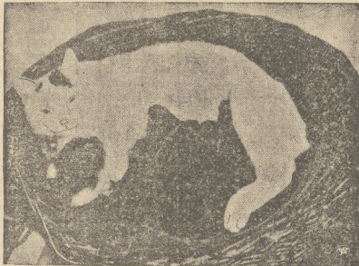
Reprodukujemy oryginalnie, pełne natu realizmu zdjęcie, przedstawiające plastyczny obraz macierzyństwa kotów

W PŁUCAMI ŚLĄSKA, GDYNIA I GDAŃSK, PUKLERZEM.