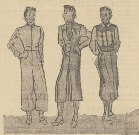
Najnowsze stroje do nart

Ty jesteś, którą nad wszystko, Ty jesteś lazurowa Tylko... czemu oczy masz tak nisko? Księżyc zakał, splunął i twarz schował.