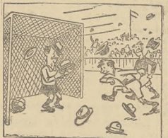
Mecz piłki nożnej podczas burzy...