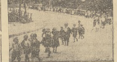
Pedaki wracają na obiad

Alc kiedy się patrzy na te gromadki enafolny, zdrowo wylęgające dzieci, gdy widać, jak bardzo smutni wśród tych dzieci smutnej biedy, to nie wydaje się, aby trud nie był wynagrodzony. Każdy kłopot gram wagi, jak przybydło temu malow,