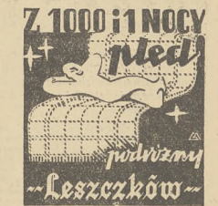
Lwów, Kopernika 2 3409

Wschody słońca? Nie przesadzajcie, mili. Nie ma nic bardziej zachyczącego