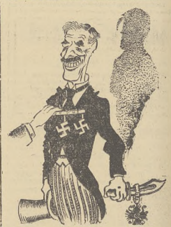
Nagroda pokojowa Nobla za rok 1938