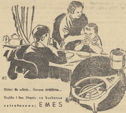
Dzieci śb. szkoły... Gorące śmiechów... Szybko i bez młopot... na kuchence E M E S

W okólniku tym czytamy m. in.: „Jeżeli należ bezwzględnie nawiązać — o ile to jeszcze nie nastąpiło — osobisty, ścisły kontakt z przewodniczącym oddziału OZN i zgłosić gotowość jak