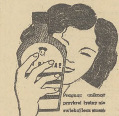
OLEUM PETRAE „Głowa”